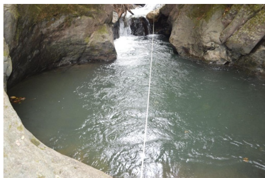
სურ. 5 სარფი