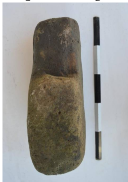
სურ. 15. სარფი