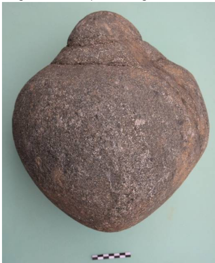
სურ. 13 თხილნარის აგარა