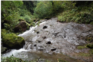
სურ. 9. თხილნარი