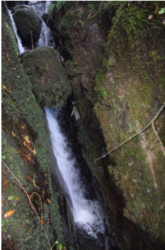
სურ. 6. გოგაძეები