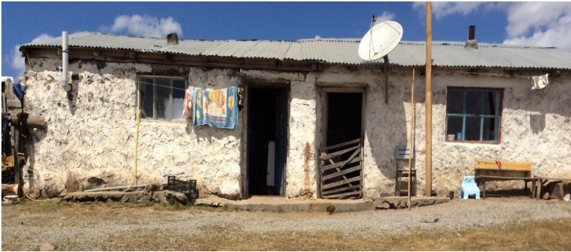
მთური საცხოვრებელი ბაღდაშენის იაილაში

მეორე ნაწილი შედარებით ახალია, რომლებშიც უფრო გვიან მოსული თურქები, ქურთები, თარაქამები, ჰემშილები და სხვა ეთნიკური ჯგუფების მესაქონლეები ცხოვრობენ.