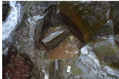
სურ. 12 სიმონეთი (ჯაზიგოლი)