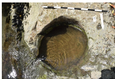
სურ. 10 სიმონეთი (ჯაზიგოლი)