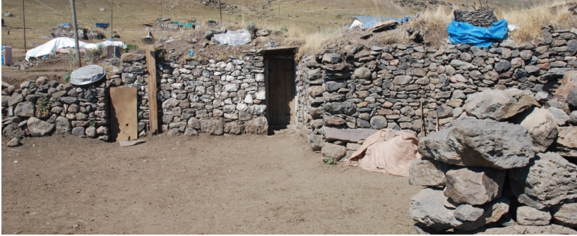
არტაანი, ქოი იალთის იაილები

მეორე ნაწილი შედარებით ახალია, რომლებშიც უფრო გვიან მოსული თურქები, ქურთები, თარაქამები, ჰემშილები და სხვა ეთნიკური ჯგუფების მესაქონლეები ცხოვრობენ.