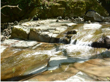
სურ. 3 სიმონეთი (ჯაზიგოლი)