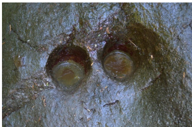
სურ. 11 სარფი